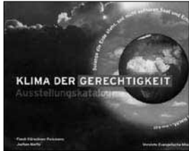
Frank Kürschner-Pelkmann, Jochen Motte (Hg.): Klima der Gerechtigkeit. Ausstellungskatalog. Vereinte Evangelische Mission, foedus-verlag, Wuppertal 2008, 219 Seiten, 10 Euro.

gen pädagogischen Angeboten. Diese bieten didaktisch und inhaltlich ansprechende und herausfordernde Module an, die in den unterschiedlichsten Zusammenhängen zum Einsatz kommen können. Die Ausstellung selbst führt behutsam von allgemeinen Informationen zum Klimawandel über zahlreiche Länderbeispiele hin zu einem umfassenden