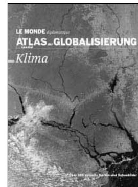
Le Monde diplomatique: Atlas der Globalisierung spezial: Klima. taz Verlag, Berlin 2008, 96 Seiten, 10 Euro.

Aspekte des Klimawandels visualisiert und oft viel prägnanter darstellt, als ein Text dies könnte. Da werden etwa Nordamerika und Europa zu riesigen Bällen auf der Erdkarte, wenn die Größen von Staaten entsprechend ihres ökologischen Fußabdrucks abgebildet werden – und Afrika schrumpft zu einem schmalen Streifen.