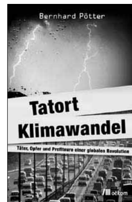
Bernhard Pötter: Tatort Klimawandel. Täter, Opfer und Profiteure einer globalen Revolution. Oekom Verlag, München 2008, 261 Seiten, 19,90 Euro.

Wer mit Lufthansa fliegt, kann „aktiv zum Klimaschutz und unmittelbar zur Reduktion von Treibhausgasen beitragen“. Diesen Unsinn will zumindest der Luffahrtkonzern mit seiner Einladung zu einer „Klimaschutzspende“ weismachen, mit der jeder Fluggast seine tonnenweise CO 2 -Emission wettmachen könne. Bernhard Pötter beschreibt detailliert, dass die meisten Klimakompensationsangebote nicht funktionieren und vor allem eine gute Geschäftsidee der Anbieter sind.