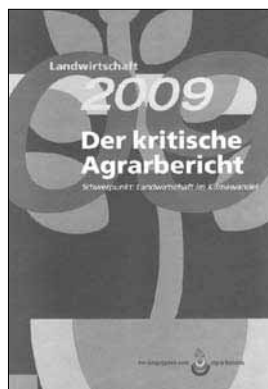
AgrarBündnis (Hg.): Landwirtschaft 2009. Der kritische Agrarbericht. Schwerpunkt 2009: Landwirtschaft im Klimawandel. ABL-Verlag, Kassel/Hamm 2009, 304 Seiten, 19,80 Euro.

Seit 1993 veröffentlicht das AgrarBündnis seinen „Kritischen Agrarbericht“. 15 der 46 Beiträge der diesjährigen Ausgabe beschäftigen sich mit dem Schwerpunkt „Landwirtschaft im Klimawandel“ – und bieten einen fundierten Einblick in das Thema. Deutlich wird, wie sehr die Erderwärmung die Landwirtschaft im Süden beeinträchtigt und die Kapriolen des Klimas durch ein zu viel oder ein zu wenig an Niederschlägen ganze Ernten vernichten. Der Ausblick ist verheerend: Manche Regionen können in Zukunft überhaupt nicht mehr landwirtschaftlich genutzt werden. Die Konsequenzen für die Ernährungssouveränität der betroffenen Länder sind klar: Hunger wird sich noch weiter ausbreiten.